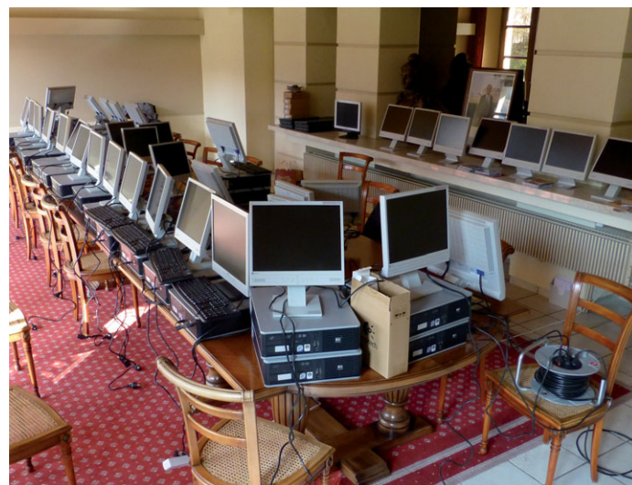
Préparation des ordinateurs de l'école dans la Salle du Conseil de la Mairie

En complément, 6 PC portables de la même provenance ont été mis à disposition des enseignants.