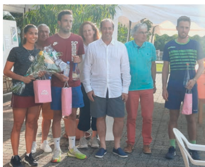
Finale OPEN 2021

Pour les jeunes et les adultes qui aiment jouer en loisir ou en compétition, les occasions de se rencontrer seront nombreuses avec des journées d'animations, des plateaux de niveau orange et vert (le 9 avril et le 11 juin), violet et rouge (le 12 juin) et plusieurs tournois (adultes à partir du 16 avril, TMC jeunes le 21 et 22/05, et d'autres dates à suivre). Au plaisir de vous retrouver au TC Evian !