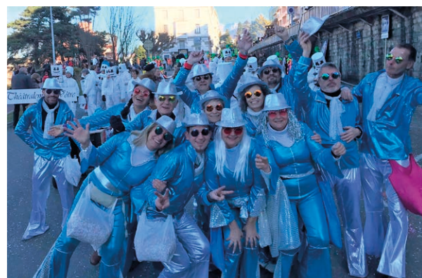
Carnaval d'Évian 2022 où l'on a fièrement représenté Neuvecelle dans le cortège!

Plus de renseignements sur le site www.theatralementvotre.fr